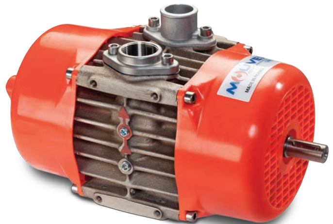
E 140 Rotationskompressor

Die vollständige Korrosionsschutzbeschichtung von Kompressor und Sicherheits-/Rückschlagventil garantieren zusammen mit den Flanschen aus rostfreien Edelstahl ein sorgenfreies Arbeiten.