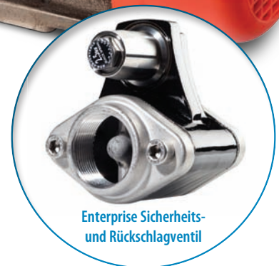
Enterprise Sicherheits- und Rückschlagventil