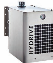
HYDRIVE Hydraulik-Ölkühler (Option)