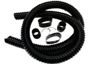
Luftansaug-Set (Lieferumfang der Enterprise-Serie)