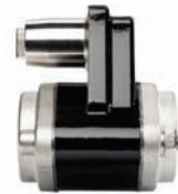
Enterprise Sicherheits- und Rückschlagventil (Lieferumfang der Enterprise-Serie)