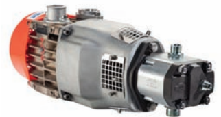
Optionen: Enterprise mit Hydraulikmotorantrieb