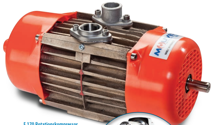
E 170 Rotationskompressor