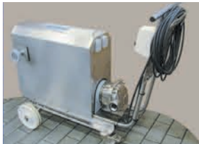
S4C EN CARRO