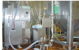
S4C CON MANGUERA FLEXIBLE