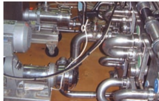
S4C PARA ENVASADO