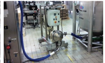
S4C PARA TRANSVASE