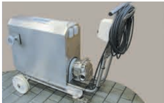
S4C SUR CHARIOT MOBILE