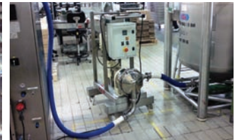
S4C EN TRANSFERT